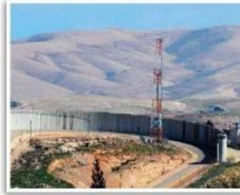
El conflicto entre Israel y Palestina tiene su raíz en la competencia entre dos comunidades por un mismo territorio al que ambas, basadas en su historia, su tradición y su religión, reclaman como propio.

Durante los primeros años de la década de 1990, Yugoslavia atravesó un proceso con enfrentamientos armados, matanzas y persecuciones, y se disolvió en múltiples estados: Serbia, Croacia, Eslovenia, Macedonia, Bosnia-Herzegovina, Montenegro y Kosovo. Sin embargo, esta división no resolvió los conflictos, y las reivindicaciones nacionalistas de las distintas comunidades continúan generando inestabilidad en la región.