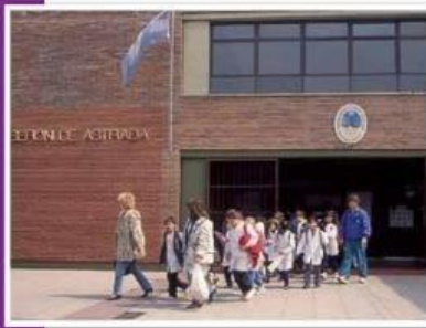
► El respeto por nuestros símbolos patrios comenzó a transmitirse en las escuelas.

El concepto de nación hace referencia a un conjunto amplio de individuos y grupos que se sienten parte de una misma comunidad por razones históricas, étnicas, lingüísticas o religiosas. Esto quiere decir que cada nación está conformada por aquellas personas que comparten un mismo idioma, una historia común y una serie de tradiciones y costumbres que la diferencian de otras comunidades, y que generan un sentimiento de pertenencia. Pero para que exista una nación es necesario, además, que quienes conforman esa comunidad se reconozcan con derecho a tener autonomía en la decisión de los asuntos que afectan la vida en común.