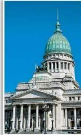
► En el Congreso de la Nación se elaboran las leyes que regulan la convivencia, atendiendo los intereses comunes de toda la sociedad.

Además, el Estado está conformado por un conjunto de instituciones , encargadas de asegurar el cumplimiento de las normas, organizar los distintos aspectos de la vida de la población, y ejecutar las políticas públicas diseñadas y establecidas por el gobierno.