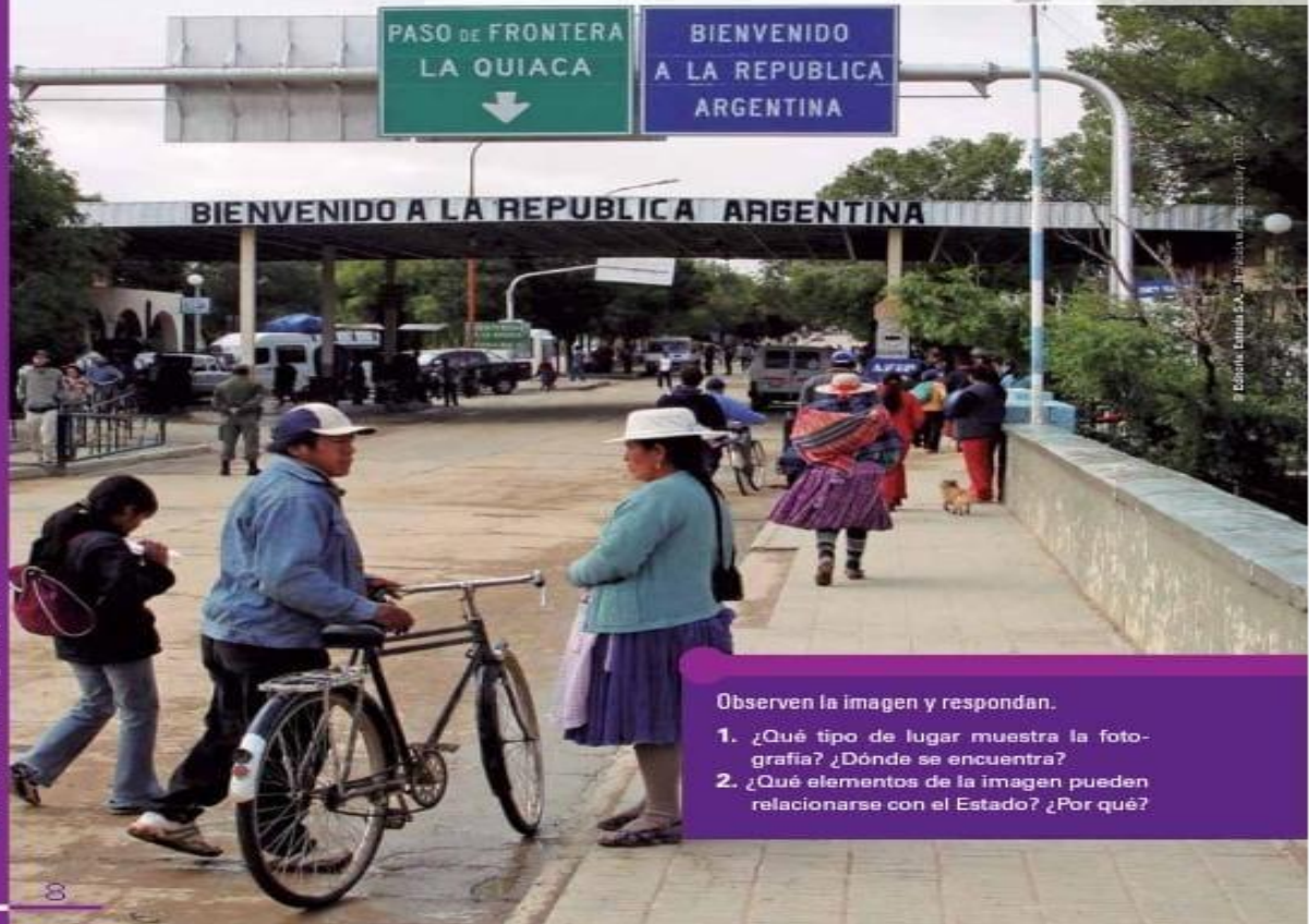
Paso fronterizo entre la Argentina y Bolivia.

El Estado es una forma de organización política. A través de sus instituciones puede ordenar, regular, establecer y hacer cumplir las normas que rigen la vida en común de una población dentro de un territorio determinado.