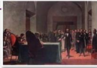
► La República Argentina nació cuando un conjunto de provincias declararon su voluntad de unirse en torno de un Estado unificado y delegaron parte de sus atribuciones para crear un poder central.

En el caso de los Estados unitarios , estos se caracterizan por la centralización del poder político y la unidad del ordenamiento jurídico en